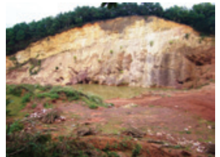
Quang cảnh mỏ sắt Kéo Mỏ, TX. Cao Bằng, tỉnh Cao Bằng sau khai thác

Khai thác khoáng sản ở nhiều nơi trong vùng cao nguyên đá vôi phía Bắc đã và đang để lại những hậu quả lớn lên môi trường và cộng đồng địa phương. Khoảng 6 vạn người dân thị xã Cao Bằng và hàng ngàn người dân khác ở hạ nguồn sông Bạc (Hà >