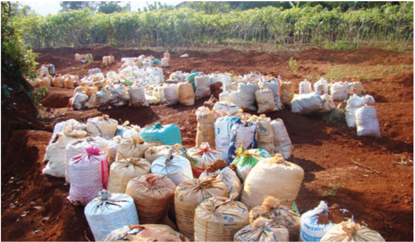
Quặng sắt được tập kết tại xã Hoàng Tung, huyện Hòa An, tỉnh Cao Bằng