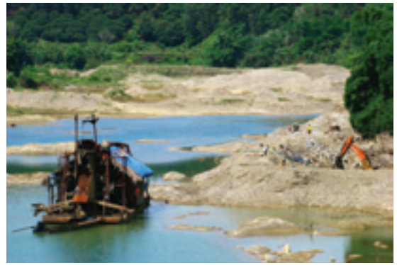
Khai thác vàng sa khoáng trên sông Gâm đoạn qua thị trấn Vĩnh Lộc, huyện Chiêm Hóa, tỉnh Tuyên Quang

Cao Bằng đã xác định được 142 mỏ và điểm quặng với 22 loại khoáng sản khác nhau, trong đó có những mỏ quy mô lớn với trữ lượng và chất lượng tốt tập trung nhiều ở các huyện Trà Lĩnh, Trùng Khánh, Hạ Lang. Trong đó, quặng sắt có trữ lượng 50-60 triệu tấn, mangan 6-7 triệu tấn, bauxit khoảng 200 triệu tấn. Ngoài ra còn có vàng và thiếc. Đặc biệt quặng mangan có thể đáp ứng nhu cầu công nghiệp sản xuất pin và luyện kim của cả nước. (Sở Tài nguyên và Môi trường Cao Bằng 2007).