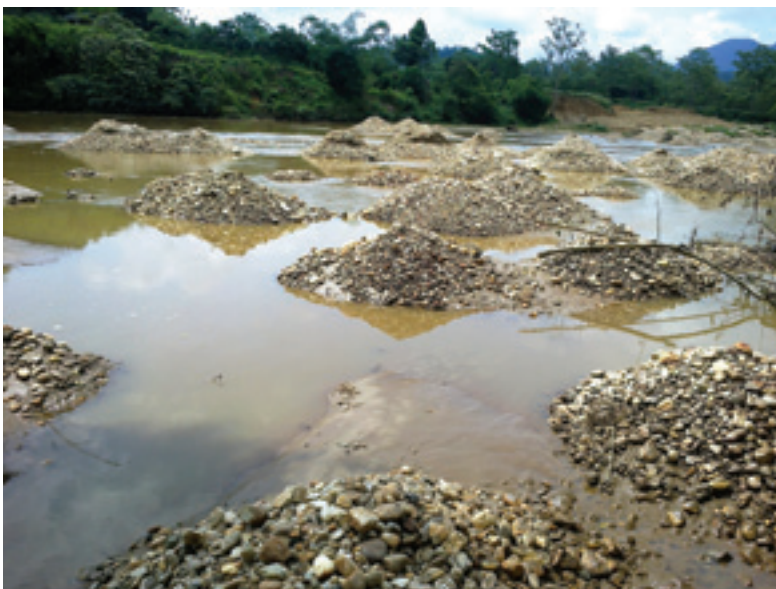
Hậu quả của việc khai thác vàng trái phép trên sông Bac, đoạn qua xã Tiên Kiêu, huyện Bắc Quang, tỉnh Hà Giang

Tài liệu này tổng hợp các thông tin về tình hình khai thác khoáng sản ở địa bàn 4 tỉnh thuộc vùng cao nguyên đá vôi phía Bắc. Nguồn thông tin chính được tập hợp từ các báo điện tử và các cổng thông tin của địa phương trong thời gian 3 năm trở lại đây. Bên cạnh đó, các chuyến điền dã của nhóm cán bộ Trung tâm Con người và Thiên nhiên cũng bổ sung thêm các cứ liệu, bằng chứng. Chúng tôi hy vọng tài liệu này sẽ giúp độc giả có cái nhìn đầy đủ hơn về bức tranh khoáng sản ở khu vực cao nguyên đá vôi phía Bắc.