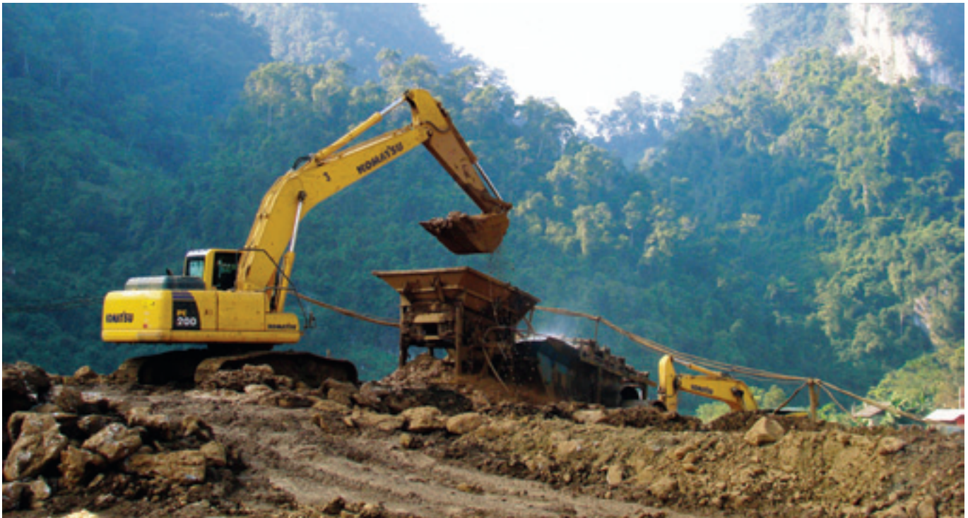
Khai thác vàng tại xã Lương Thành, huyện Na Rì, tỉnh Bắc Kạn