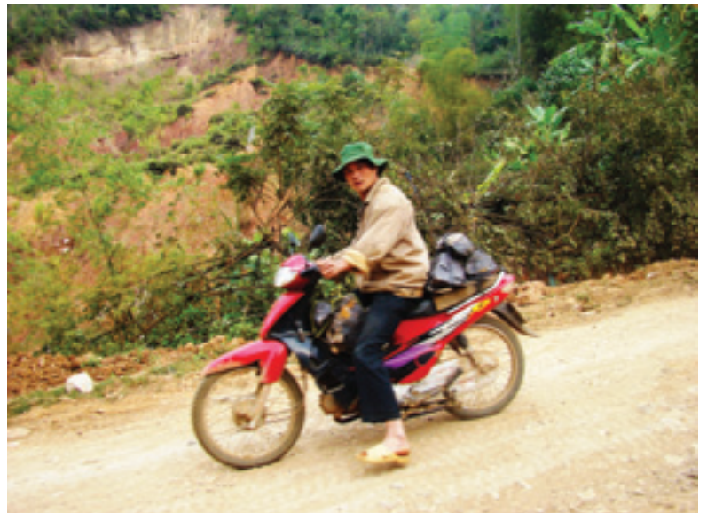
Vận chuyển quặng sắt trái phép quanh khu vực mỏ sắt Nà Lùng, TX. Cao Bằng, tỉnh Cao Bằng

Quặng thô xuất lậu không chỉ có nguồn gốc từ các điểm khai thác nhỏ lẻ của người dân hoặc các mỏ khai thác thổ phi mà bao gồm cả các doanh nghiệp được cấp phép. Câu hỏi đặt ra là: trong vòng một năm có bao nhiêu tấn quặng thô của khu vực này bị xuất lậu qua biên giới?